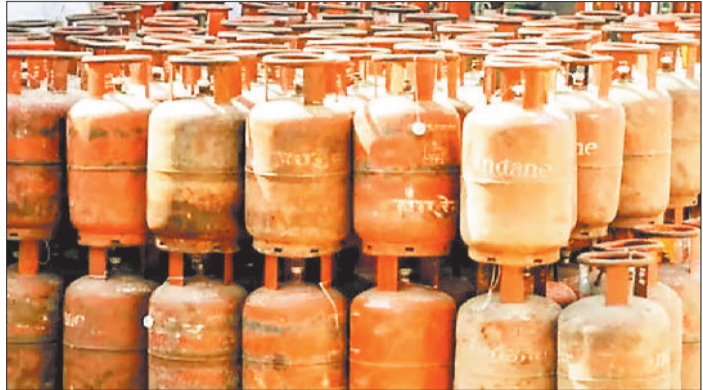
गोदाम में रखा सिलेंडर।

जिले में कामर्शियल सिलेंडरों की आपूर्ति बंद हो चुकी है, जिसके कारण होटल ढाबा संचालकों की परेशानी बढ़ गई है। स्थिति यह है कि चाट भंडार, ठेला संचालन करने वाले कई छोटे व्यवसायियों का उनका व्यवसाय प्रभावित हो रहा है। छोटे व्यापारियों पर रोजी-रोटी का संकट पैदा हो गया है। गौरतलब है कि जांजगीर-चांपा जिले के पांच ब्लॉक अंतर्गत करीब 5 लाख से अधिक उपभोक्ता गैस सिलेंडरों का उपयोग घरेलू गैस सिलेंडर एवं कमर्शियल के रूप में करते हैं। साथ ही साथ जिले में 25 गैस एजेंसियों का संचालन भी किया जा रहा है। इधर ईरान-इराक एवं अमेरिका युद्ध का असर तेल एवं गैस पर पड़ रहा है। स्थिति यह है कि जांजगीर-चांपा जिले के अधिकांश गैस एजेंसी में कमर्शियल गैस सिलेंडरों की आपूर्ति बंद हो चुकी है। इसका असर होटल, ढाबा, मिष्ठान भंडार समेत अन्य ठेला, चाट भंडार संचालन करने वाले छोटे व्यापारियों पर देखने को मिल रहा है। छोटे व्यापारियों पर रोजी-रोटी का संकट पैदा हो गया है। जिला मुख्यालय जांजगीर में ही कचहरी चौक, नेताजी चौक, जिला शिक्षा अधिकारी कार्यालय के पास चौपाटी में बड़े पैमाने पर चाट भंडार, समोसा, मोमोज समेत अन्य दुकानों का संचालन बड़े पैमाने पर किया जाता है, लेकिन कमर्शियल गैस सिलेंडर की आवक बंद हो जाने के कारण छोटे व्यापारियों पर इसका असर देखने को