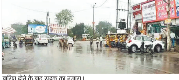
बारिश होने के बाद सड़क का नजारा।

हरिभूमि न्यूज ►► कोरबा मौसम में कुछ दिनों से आ रहे बदलाव के कारण तापमान में गिरावट आने से लोगों को मार्च महीने में पड़ रही तेज गर्मी से राहत मिली है। दो दिन पूर्व शहर और उपनगरीय क्षेत्रों सहित ग्रामीण अंचलों में तेज बारिश हुई तो कुछ स्थानों में ओले गिरने की घटना हुई है। मौसम विभाग ने बदलाव को लेकर अलर्ट भी जारी किया है। इसमें तेज आंधी की संभावनाएं जताई गई है। अंचल में तेज गर्मी ने मार्च महीने से ही दस्तक दे दी है। तापमान 35