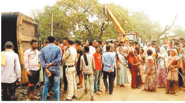
मौके पर उपस्थित ग्रामीणों की भीड़।