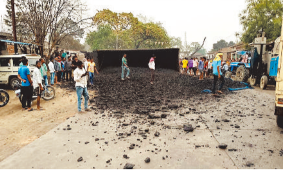
घटना स्थल पर पलटी ट्रेलर वाहन।