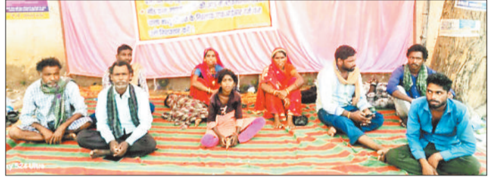
अनिश्चितकालीन आंदोलन पर बैठा आदिवासी परिवार।

गोंडवाना गणतंत्र पार्टी के नेता के खिलाफ सविराया आदिवासी परिवार गुरुवार से दो सूत्रीय मांगों को लेकर अनिश्चितकालीन धरने पर बैठ गया है। उनकी पहली मांग है कि उनके खिलाफ झूठी शिकायत की गई है उसे वापस लिया जाए। वहीं दूसरी मांग है कि गोंडवाना गणतंत्र पार्टी की आड़ में ब्लैकमेलिंग करने वाले के खिलाफ एफआईआर दर्ज कर उसे गिरफ्तार किया जाए। धरने में बैठे आदिवासी परिवार का कहना है कि गोंडवाना पार्टी के एक नेता द्वारा धमकी देते हुए ब्लैकमेलिंग किया जा रहा है। आदिवासी परिवार का आरोप है कि उस नेता के द्वारा उनसे 5 लाख की मांग गई थी थी नहीं देने पर उनकी जमीन हथियाने